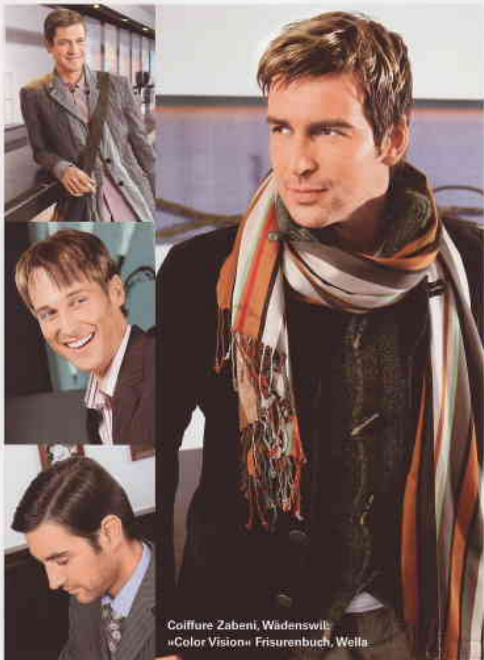
Coiffure Zabeni, Wädenswil: »Color Vision« Frisurenbuch, Wella

Coiffure Zabeni: Mohawks, schrille Farben und »Vokuhila« (= vorne kurz, hinten lang). >