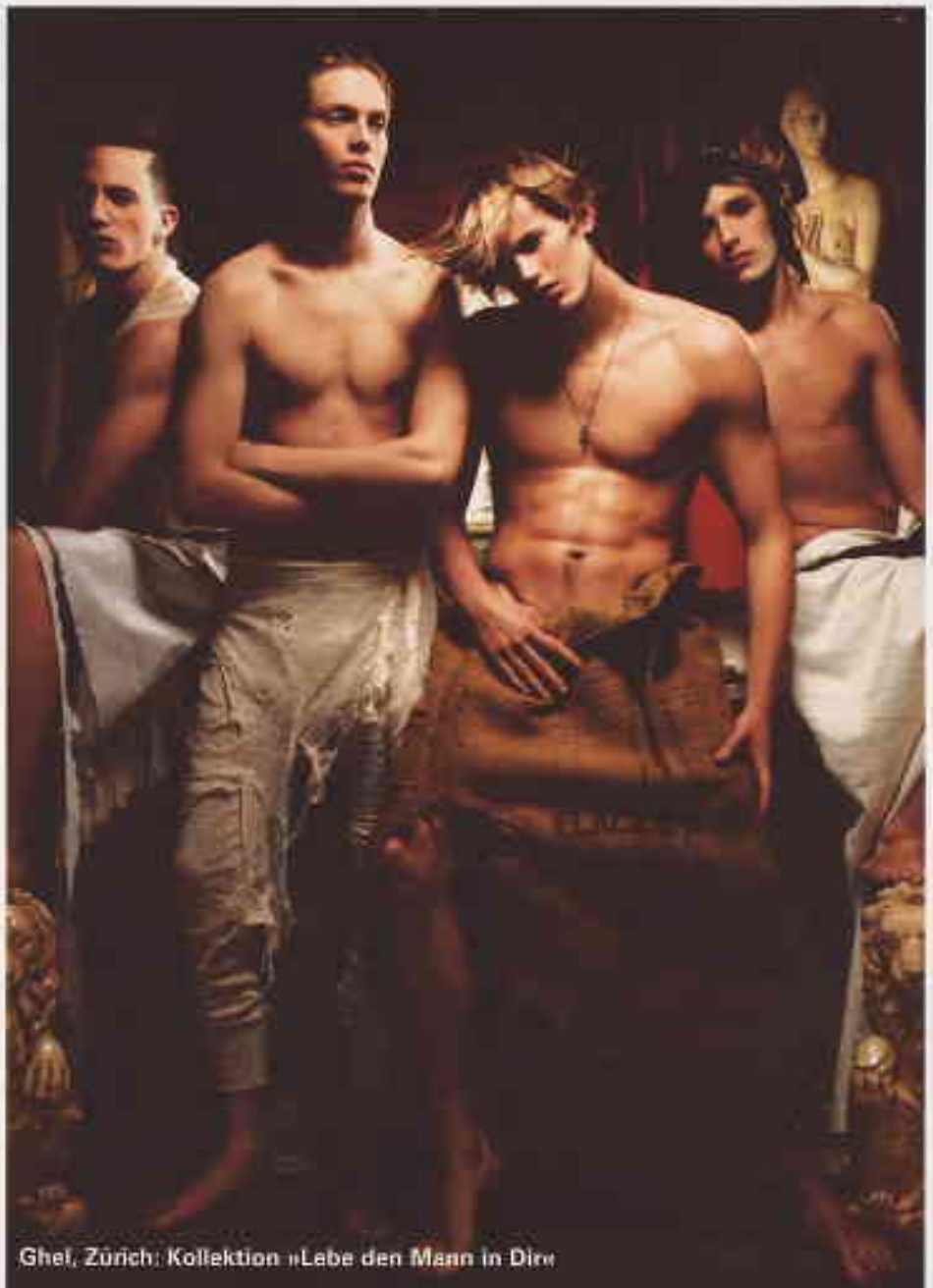
Ghel, Zürich: Kollektion »Lebe den Mann in Dir«